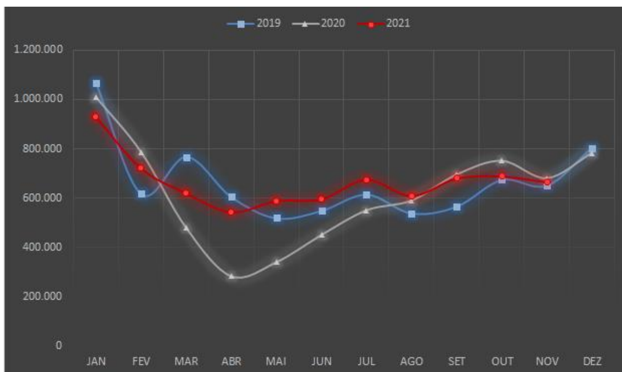
Gráfico 1 – Evolução do tráfego mensal realizado nos anos 2020 e 2021 com o de 2019.